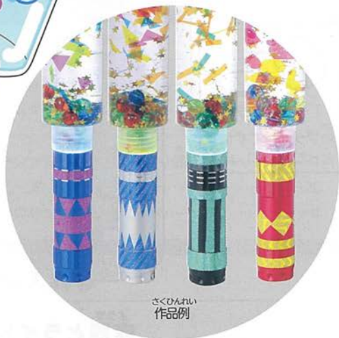
さくひんれい 作品例